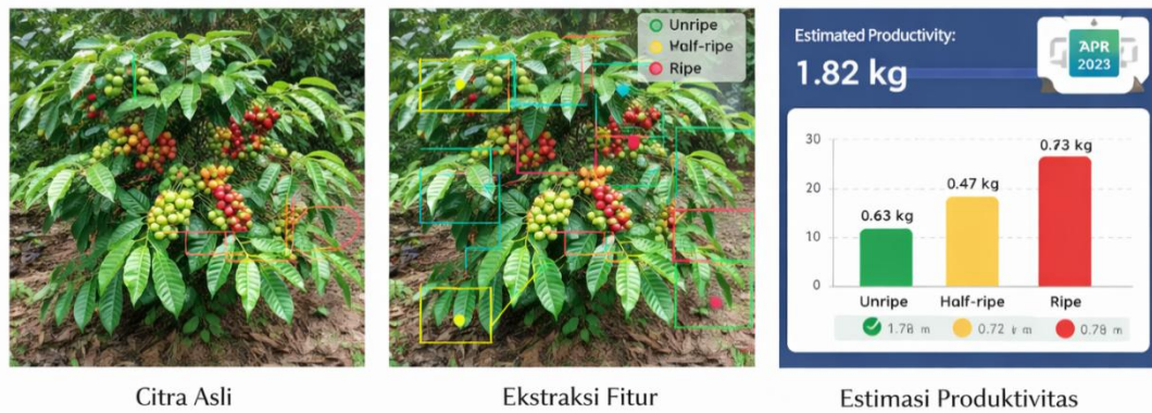
Gambar 2. Visualisasi hasil ekstraksi fitur visual tanaman kopi

Gambar 2 menunjukkan proses identifikasi fitur visual tanaman kopi. Citra asli digunakan sebagai input , kemudian dilakukan deteksi buah berdasarkan tingkat kematangan menggunakan penandaan warna. Fitur visual hasil ekstraksi fitur tersebut selanjutnya digunakan sebagai variabel input dalam proses estimasi produktivitas tanaman dalam satuan kilogram.