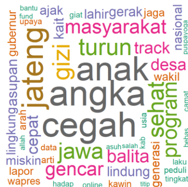
(b) Word Cloud