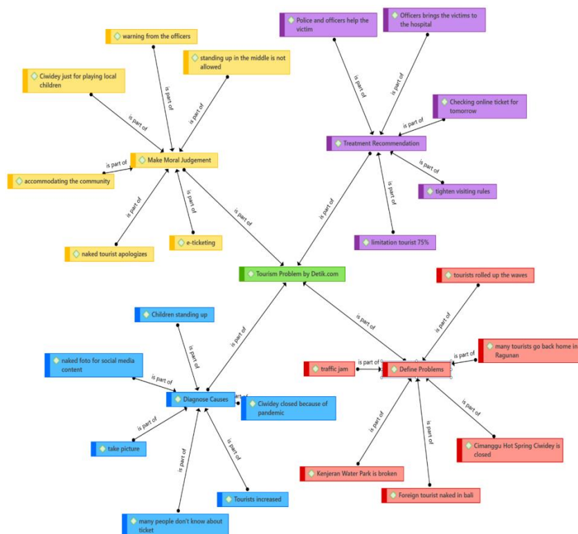
Gambar 2. Framing Isu Terkait Pariwisata pada Detik.com