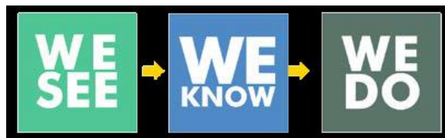
Gambar 2. Taktik Kampanye Vaksinasi Campak Rubella

WE SEE (Kita Lihat) dimaknai sebagai taktik agar masyarakat dapat melihat kebenaran tentang Fenomena Campak dan Rubella, karena sasaran utama dalam vaksinasi campak rubella ini adalah millennial (masyarakat), maka konten WE SEE harus menyesuaikan dengan sasaran terkait. Seperti dibuat dalam bentuk digital (visual), dipublikasikan melalui media millennial, dan membuat konsep yang kuat untuk menarik perhatian millennial untuk memberikan feedback .