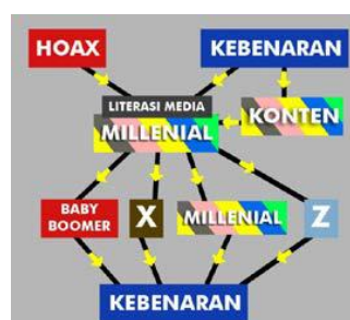
Gambar 1. Alur Retribusi terkait Vaksinasi

Terkait dengan kampanye vaksinasi campak rubella adalah sebuah pemahaman konotasi yang terbranding oleh bagaimana pesan disampaikan oleh media, secara baik atau tidak. Dalam artian hoax atau kebenaran yang realitas terjadi. Semua kembali pada bagaimana masyarakat mampu menelaah apa yang harusnya dipahami untuk dijadikan acuan dalam bersikap dan menentang sesuatu hal yang mungkin saja keliru.