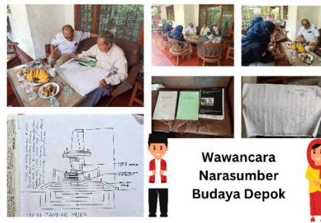
Gambar 4. Kegiatan Wawancara dengan Narasumber Budaya Depok