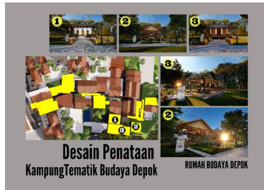
Gambar 9. Penataan kembali Rumah Budaya Depok