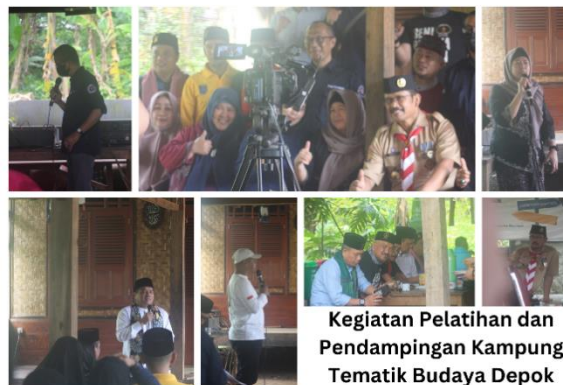
Gambar 6. Kegiatan Pelatihan dan Pendampingan Kampung Tematik Budaya Depok

Perencanaan penataan kampung tematik Budaya Depok, menjadi luaran akhir dari kegiatan Program Kumpulan Orang Orang Depok (KOOD) berbudaya. Dari proses survey lapangan akan ditemukan potensi dan kelemahan tapak (lokasi studi) sehingga dapat diusulkan bentuk penataan kampung tematik budaya dan kawasan wisata budaya Depok yang paling sesuai dengan kondisi alam lokasi setempat dan keinginan dari masyarakat.