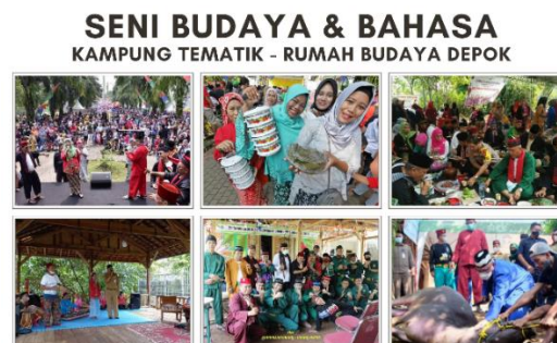
Gambar 1. Bentuk Kegiatan KOOD dalam Bidang Seni dan Budaya Depok

Pelaksanaan kegiatan budaya, seni dan bahasa yang telah dilaksanakan selama ini oleh Kumpulan Orang-Orang Depok (KOOD) berbudaya, merupakan bentuk adanya keinginan masyarakat untuk terus melestarikan nilai budaya Depok.