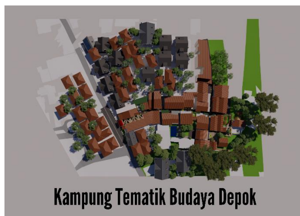
Gambar 8. Lokasi Perencanaan Penataan Kampung Tematik Budaya Depok

Dari hasil perencanaan penataan kampung tematik budaya Depok, penataan akan dilakukan disepanjang gang salamunah kp. Rawa denok, Kota Depok.