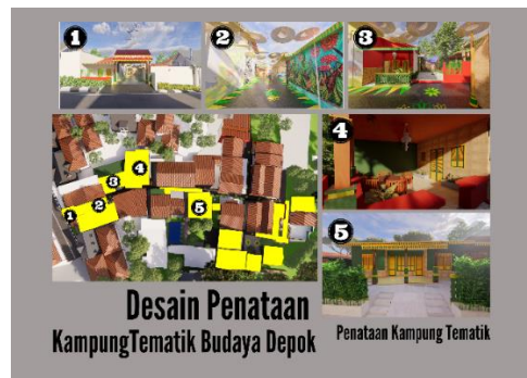
Gambar 10. Desain Penataan Kampung Tematik Budaya Depok