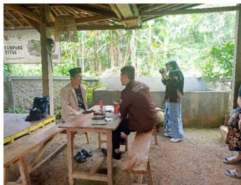
Gambar 5. Kegiatan Wawancara dengan Narasumber Arsitektur Tradisional Depok