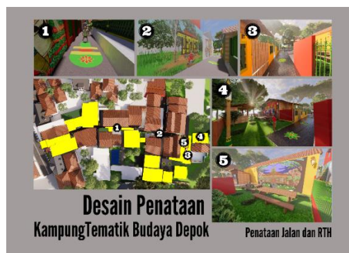
Gambar 11. Desain Penataan Jalan dan RTH di Kampung Tematik Budaya Depok