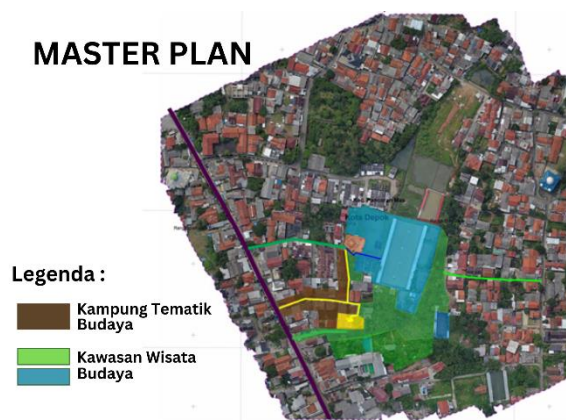
Gambar 7. Rencana Kawasan Wisata Budaya dan Kampung Tematik Budaya Depok