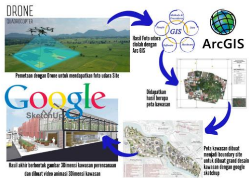
Gambar 2. Proses Pemetaan Lokasi Studi