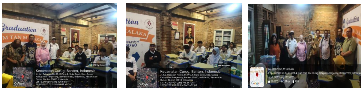
Gambar 2. Pelaksanaan Kegiatan Pengabdian Kepada Masyarakat di Yayasan AgenKultur Tan Malaka

Pelaksanaan kegiatan pengabdian kepada masyarakat (PKM) yang dilaksanakan di PKBM Tan Malaka berhasil memberikan sejumlah capaian penting yang relevan dengan kebutuhan mitra dalam meningkatkan literasi teknologi informasi. Kegiatan ini diawali dengan identifikasi kondisi peserta yang sebagian besar memiliki keterbatasan dalam keterampilan komputer serta minim pengalaman menggunakan komputer dan teknologi digital sebagai sarana belajar maupun aktivitas sehari-hari. Berdasarkan temuan tersebut, Tim Universitas Gunadarma merancang program pelatihan yang mencakup materi pengenalan komputer, penggunaan internet secara produktif, serta pengenalan konsep digital marketing sebagai keterampilan pendukung kegiatan ekonomi peserta. Pelatihan dilaksanakan oleh tiga puluh orang pelaksana yang berperan sebagai tutor dan asisten tutor, sementara kuliah umum dipandu oleh lima pelaksana dengan bantuan mahasiswa yang berperan sebagai pendamping. Kegiatan pelatihan berjalan sesuai rencana, melibatkan siswa-siswi SMP (Paket B) dan SMA (Paket C) yang secara aktif mengikuti seluruh rangkaian pembelajaran. Dokumentasi kegiatan tersebut dapat dilihat pada gambar 2 berikut sebagai bukti visual atas keterlibatan peserta dan proses pembelajaran yang berlangsung.