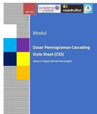
Gambar 3. Luaran Berupa Modul Dasar Pemrograman CSS

Kegiatan PKM ini juga menghasilkan luaran penting yang berkontribusi pada penguatan kapasitas lembaga PKBM Tan Malaka dalam menyediakan pembelajaran berbasis teknologi. Salah satu luaran utama adalah penyusunan Modul Dasar Pemrograman CSS, yang dirancang sebagai materi pembelajaran lanjutan bagi peserta yang ingin memahami dasar-dasar pemrograman web. Modul tersebut telah diuji coba selama pelatihan dan mendapatkan respons positif dari peserta maupun pengajar. Modul ini juga telah terdaftar secara resmi sebagai Hak Kekayaan Intelektual berupa Hak Cipta, sehingga PKBM dapat menggunakannya secara berkelanjutan sebagai bagian dari kurikulum pelatihan teknologi informasi. Gambar 3 merupakan luaran berupa Modul Dasar Pemrograman CSS yang telah memperoleh Hak Cipta dan siap digunakan sebagai materi pembelajaran di PKBM Tan Malaka.