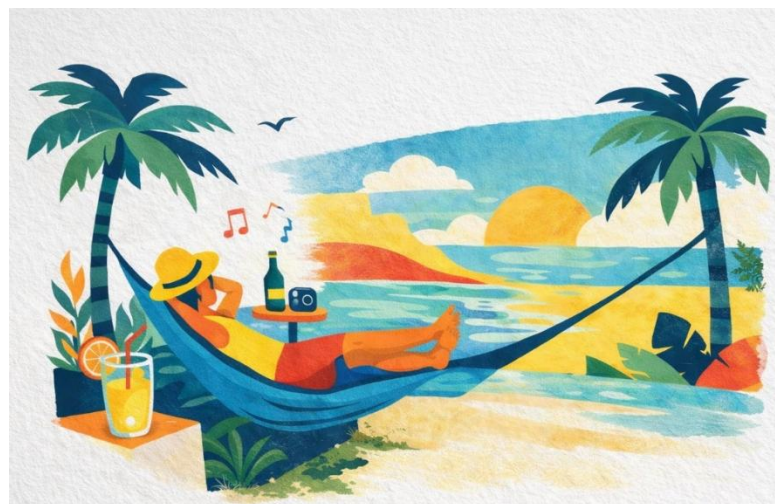
Gambar 5. Rekomendasi Desain Mural

Konsep untuk desain mural pada dinding di ruang penyimpanan bertemakan tentang Dunia Anak, yang artinya dunia anak yang penuh warna-warni dan ceria. Karena lokasinya yang berdampingan dengan tempat bermain. Temanya disesuaikan agar membawa keceriaan dalam setiap mereka bermain.