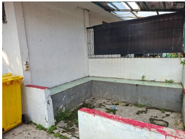
Gambar 3. Kondisi Dinding Area Santai

Bangunan penyimpanan barang properti ini cukup sederhana dan satu masa bangunan, dengan ukuran dinding yang akan dijadikan media mural berukuran 4m x 2.5m. Kondisi dinding saat ini sangat baik dan tidak berlumut. Sehingga dapat memudahkan dalam proses pengecatan.