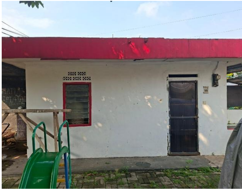
Gambar 2. Kondisi Dinding Ruang Penyimpanan

Bangunan penyimpanan barang properti ini cukup sederhana dan satu masa bangunan, dengan ukuran dinding yang akan dijadikan media mural berukuran 4m x 2.5m. Kondisi dinding saat ini sangat baik dan tidak berlumut. Sehingga dapat memudahkan dalam proses pengecatan.