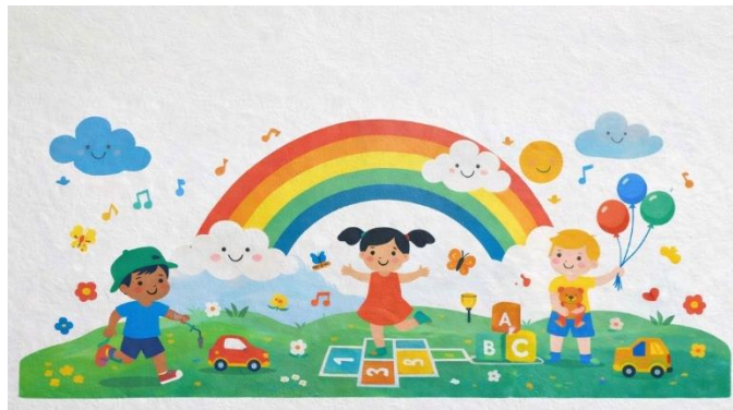
Gambar 4. Rekomendasi Desain Mural

Tema dan konsep pada desain mural yang akan dipakai adalah yang mengandung unsur warna-warna yang ceria dan gambar-gambar dunia fantasinya anak-anak. Karena taman lingkungan ini lebih sering dikunjungi oleh anak-anak yang berumur balita hingga anak berumur 10 tahun.