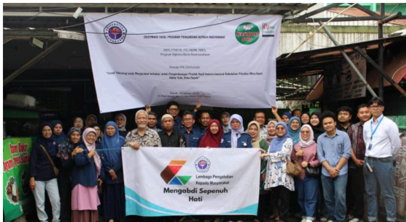
Gambar 4. Dokumentasi Pelaksanaan Pada Mitra Ayam Bakar Solo, Kota Depok

Indikator capaian pada bulan ke lima ini adalah publikasi pada media massa cetak online yaitu depok news dengan link https://depoknews.id/171633-2/ , HKI Program Komputer Granted EC002026019463, 30 Januari 2026