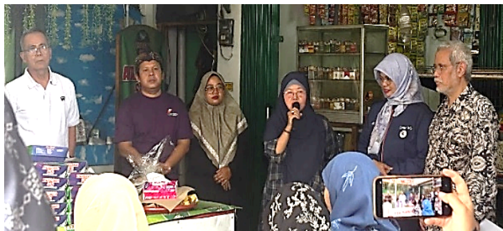
Gambar 1. Profil Mitra: Kelompok Usaha Ayam Bakar Solo, Kota Depok.

mendorong pertumbuhan ekonomi UMKM yang berkualitas dan berkelanjutan (Prasetyo & Kistanti, 2020). Studi literatur menunjukkan bahwa aset modal sosial terdiri dari tiga elemen utama (Janah dkk., 2024), yaitu pertama, kepercayaan ( trust ) dalam bentuk keyakinan antar pemilik, karyawan dan pelanggan yang memudahkan transaksi non-tunai. Kedua, jaringan ( networks ) dalam bentuk hubungan mitra dengan pemasok bahan baku yang mendukung keberlanjutan usaha. Ketiga, norma ( norms ) dalam bentuk gotong royong atau etika bisnis lokal.