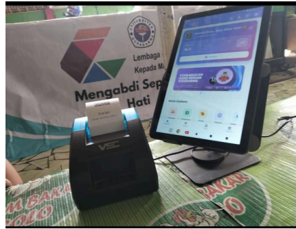
Gambar 2 . Hasil Penerapan IPTEKS Dengan Menggunakan Aplikasi POS “Kios Darma”