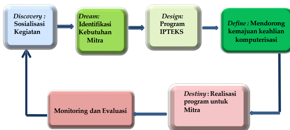
Gambar 1. Metode Pelaksanaan berbasis Pendekatan ABCD

Metode pelaksanaan kegiatan Pengabdian kepada Masyarakat ini menerapkan metode ABCD (Asset-based, Community Development) meliputi Discovery (menemukan aset), Dream (memimpikan masa depan), Design (merancang rencana), Define (memastikan dan menetapkan tujuan), dan Destiny (melaksanakan dan mewujudkan). Tiga tahapan pelaksanaan program adalah sebagai berikut,