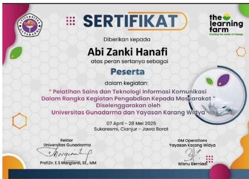
Gambar 3. Sertifikat Peserta Pelatihan