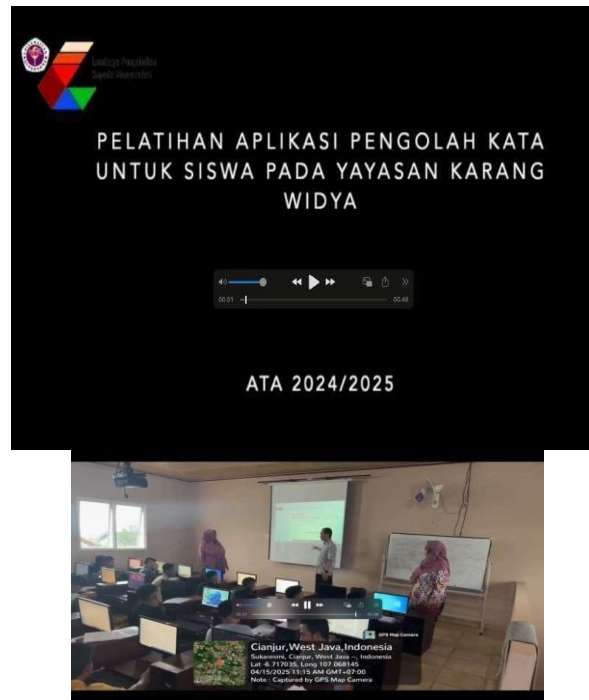
Gambar 6 Tampilan Video Pelatihan

Tangkapan layar video pelaksanaan pelatihan Pengolah Kata dapat dilihat pada link berikut: https://bit.ly/VideoKegiatanATA2425