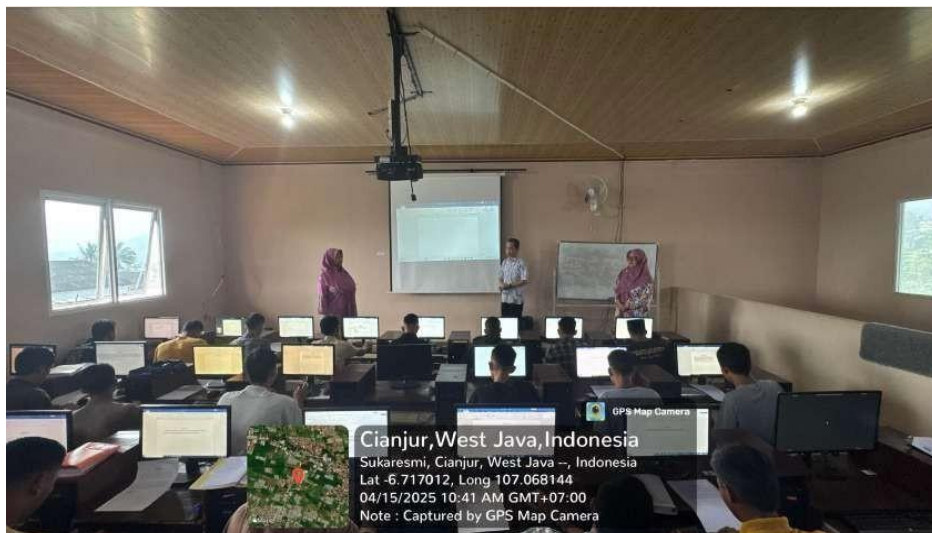
Gambar 2. Ruang Pelatihan

Pelatihan Pengenalan Aplikasi Pengolah Kata berjalan dengan baik dan lancar. Peserta dapat memahami dan mengikuti materi yang disampaikan oleh pembicara. Beberapa contoh dokumentasi kegiatan dapat dilihat pada gambar.