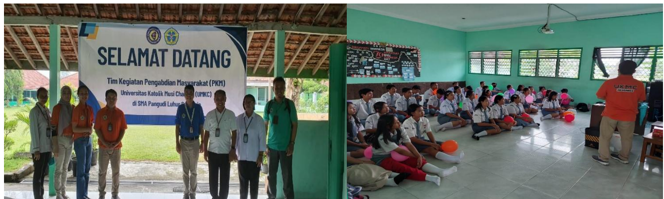
Gambar 2. Pelaksanaan PkM secara luring di SMA Pangudi Luhur Sukaraja

Tahap pertama dilaksanakan secara daring pada tanggal 8 Oktober 2025, yang difokuskan pada pelatihan awal bagi pengurus OSIS terkait desain slide presentasi yang jelas, sistematis, dan menarik (Gambar 1). Kegiatan ini bertujuan untuk membekali peserta dengan kemampuan dasar dalam menyusun materi presentasi program kerja yang akan dipraktikkan pada tahap berikutnya. Tahap kedua dilaksanakan secara luring pada tanggal 13 Oktober 2025 pukul 08.00–11.30 WIB di SMA Pangudi Luhur Sukaraja (Gambar 2). Kegiatan ini melibatkan 138 siswa yang dibagi menjadi dua kelompok, yaitu kelompok pengurus OSIS dan kelompok siswa non-OSIS dari kelas X, XI, dan XII.