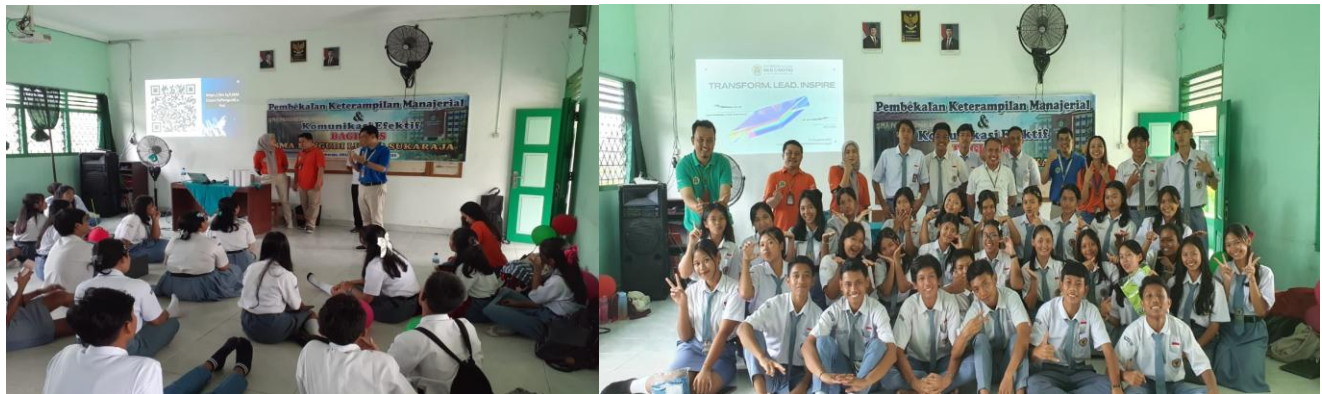
Gambar 9 dan 10. Materi Ketrampilan Manajerial dan Foto Bersama Usai Kegiatan PkM

Meskipun demikian, pelaksanaan kegiatan ini juga mengungkap beberapa hambatan yang relevan untuk dibahas. Pada tahap awal, sebagian besar siswa non-OSIS menunjukkan tingkat kepercayaan diri yang rendah dan cenderung pasif dalam berpartisipasi. Selain itu, keterbatasan pengalaman berbicara di depan umum menyebabkan beberapa peserta masih bergantung pada teks atau membaca slide saat presentasi, sehingga mengurangi efektivitas komunikasi. Faktor lain yang turut menjadi kendala adalah keterbatasan waktu latihan, yang membuat tidak semua peserta memperoleh kesempatan praktik yang merata. Temuan ini menunjukkan bahwa rendahnya kemampuan komunikasi siswa tidak hanya disebabkan oleh kurangnya pemahaman konseptual, tetapi juga oleh faktor psikologis dan minimnya exposure terhadap pengalaman praktik.