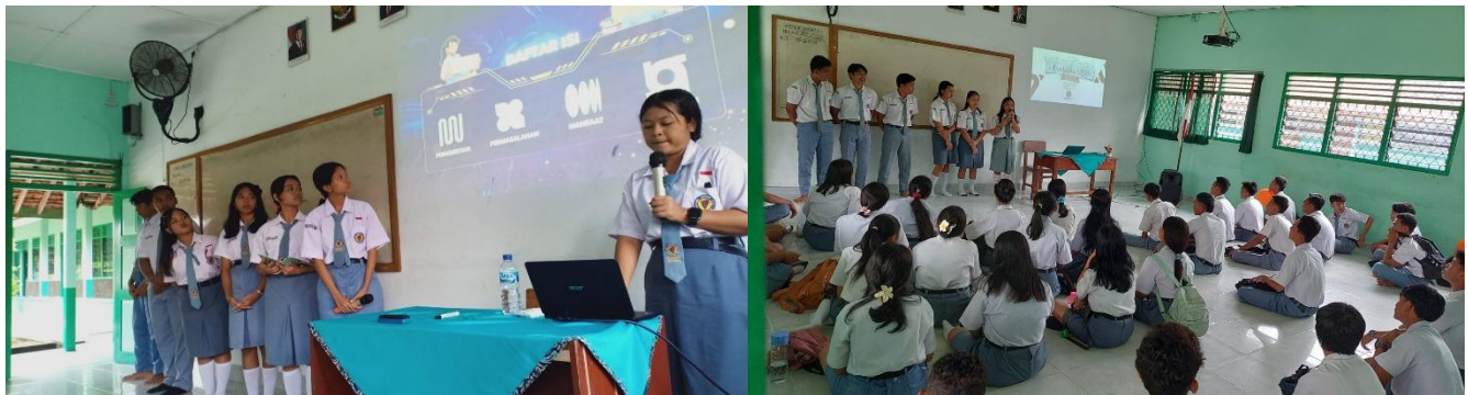
Gambar 5. Tim OSIS yang mempresentasikan program kerja dan refleksi dari peserta

Metode evaluasi dalam kegiatan ini dilakukan secara kualitatif dan partisipatif melalui observasi langsung, penilaian rekan sejawat ( peer evaluation ), serta refleksi peserta (Gambar 5). Indikator ketercapaian kegiatan meliputi peningkatan kepercayaan diri peserta dalam berbicara di depan umum, kemampuan menyusun dan menyampaikan pesan secara terstruktur, penggunaan aspek vokal, verbal, dan visual yang lebih baik, serta partisipasi aktif dalam setiap sesi kegiatan. Selain itu, keberhasilan kegiatan juga diukur dari kemampuan pengurus OSIS dalam menyampaikan presentasi program kerja secara lebih jelas dan menarik di hadapan peserta lain (Tabel 1).