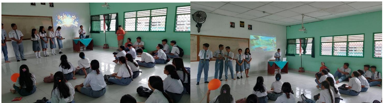
Gambar 4. Tim OSIS yang mempresentasikan program kerja OSIS di hadapan siswa lainnya

Setelah pemaparan konsep, peserta dilibatkan dalam latihan menyusun pesan melalui aktivitas “Sambung Cerita Spontan” yang bertujuan melatih kemampuan berpikir cepat dan menyusun narasi secara logis. Kegiatan kemudian dilanjutkan dengan latihan inti berupa “Pidato 1 Menit Spontan”, di mana peserta diminta menyampaikan gagasan secara singkat dengan memperhatikan aspek V-V-V. Pada tahap akhir, peserta melakukan refleksi pembelajaran serta menyampaikan komitmen untuk meningkatkan keterampilan komunikasi mereka secara berkelanjutan.