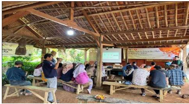
Gambar 3.1. Pelaksanaan Kegiatan Pelatihan dan Pendampingan UMKM “Mengembangkan Usaha Melalui Pelatihan Digital Marketing”

Untuk lebih jelasnya pelaksanaan kegiatan Pelatihan dan Pendampingan Pengembangan Usaha melalui pelatihan Digital Marketing dan pendataan UMKM dapat dilihat pada gambar dibawah ini dan dilampiran.