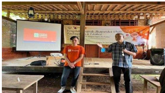
Gambar 3.2. Kegiatan Konsultasi antara pelaku UKM KOOD dengan para narasumber