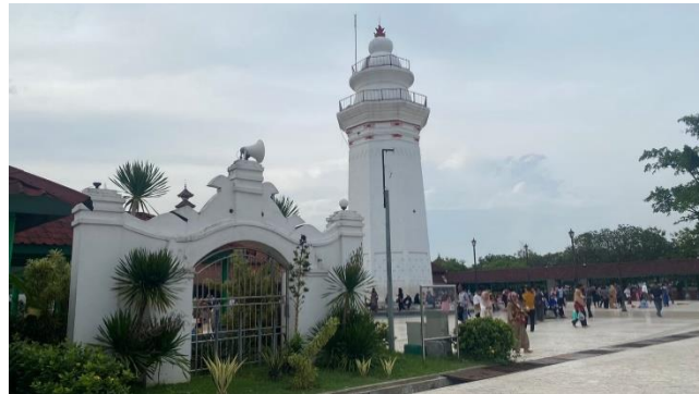
Gambar 9 Menara Dan Gapura Masjid Agung Banten