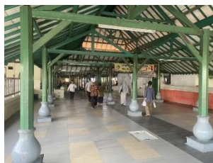
Gambar 16 Material Pondasi Masjid Agung Banten