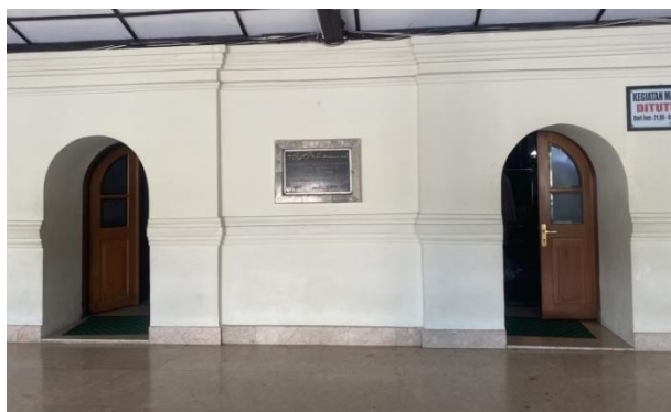
Gambar 12 Pintu Sisi Timur Masjid Agung Banten

Dinding pembatas antara kawasan masjid dan makan ternyata dinding tersebut peninggalan dulu yang sampai sekarang masih kokoh. Dinding dengan tinggi 1 meter ini menyerupai dinding pembatas keraton maupun kesultanan Jawa dengan beberapa ukiran pada gerbang atau gapura dinding pembatas ini.