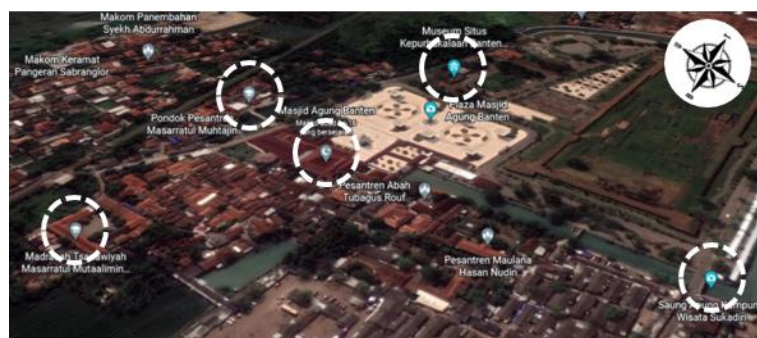
Gambar 2 Batasan Wilayah Masjid Agung Bante

Fasad bangunan masjid ini memiliki gaya arsitektur Nusantara dengan