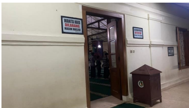
Gambar 11 Pintu Sisi Utara Masjid Agung Banten

Berdasarkan hasil pengamatan penelitian pada Masjid Agung Banten terdapat beberapa elemen arsitektural yang dianggap bahwa Masjid Agung Banten memiliki Konsep Arsitektur Nusantara pada bagian fasad dan memiliki ornamen dengan ciri khas peninggalan arsitektur Jawa yaitu pada bagian atap, pagar dan kolom, menara dan gapura, dinding, pintu, jendela, kolam.