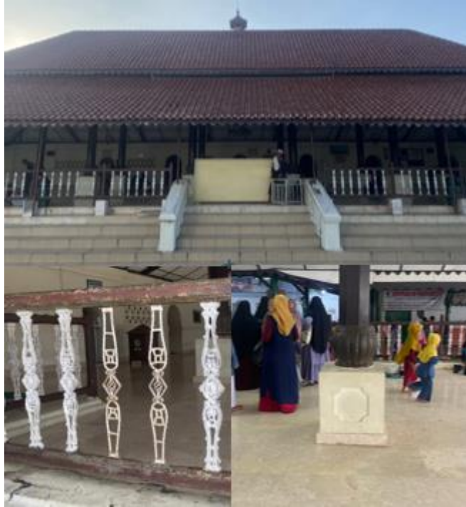
Gambar 8 Tampak Depan Masjid Agung Banten