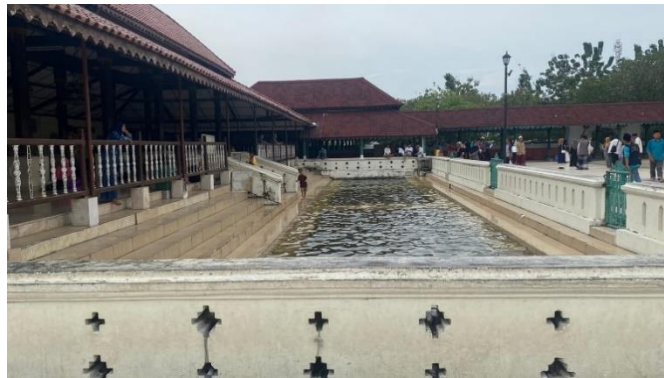
Gambar 14 Kolam Masjid Agung Banten