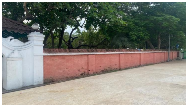
Gambar 10 Dinding Masjid Agung Banten