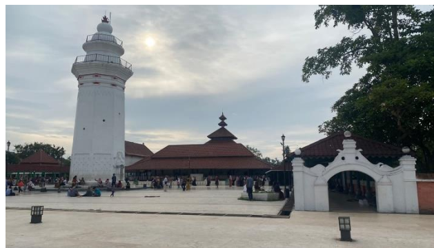
Gambar 1 Fasad Masjid Agung Banten

Masjid Agung Banten merupakan situs bersejarah peninggalan Kesultanan Banten. Masjid ini terletak di Desa Banten Lama, Kecamatan Kasemen, Kota Serang. Masjid ini menawarkan fasilitas yang digunakan untuk kegiatan ziarah dan terdapat alun-alun dikawasan masjid. Bangunan ini tidak hanya kental dengan gaya Nusantara namun gaya Modern juga ikut berperan terhadap visual bangunan. Tidak berbeda dengan masjid lain, masjid ini juga memiliki ruang utama lainnya seperti tempat sholat, mihrab (tanda arah kiblat), mimbar (tempat duduk memberikan ceramah), serambi dan tempat wudhu.