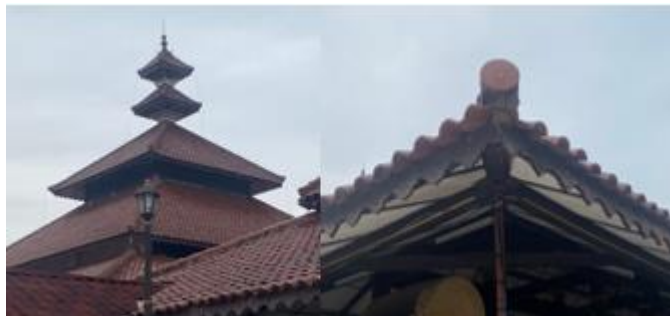
Gambar 7 Atap Masjid Agung Banten