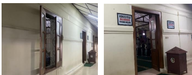
Gambar 18 Material Pintu dan Jendela Masjid Agung Banten

Pintu dan jendela pada bangunan masjid menggunakan material kayu dengan finishing pelitur. Material kayu merupakan material yang banyak ditemukan di Indonesia dan banyak di gunakan pada bangunan-bangunan tradisional.