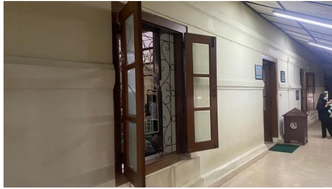
Gambar 13 Jendela Masjid Agung Banten