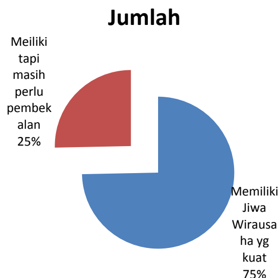
Gambar 2. Pengelompokan Kepemilikan Jiwa Kewirausahaan Responden

Dikaitkan dengan kriteria dari Schmidt, dari hasil tersebut diperoleh pengelompokan sebagai berikut :