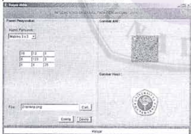
Gambar 6. Tampilan hasil dekripsi

Setelah menggunakan Aplikasi Penyandian Citra ini, penulis mendapatkan beberapa catatan. Catatan tersebut diantaranya; sandi Hill merupakan metode penyandian sederhana yang cocok diterapkan pada citra dengan variasi warna tinggi (seperti foto), dan tidak cocok diterapkan pada citra yang warnanya tidak terlalu bervariasi. Keuntungan utama pemakaian sandi Hill untuk