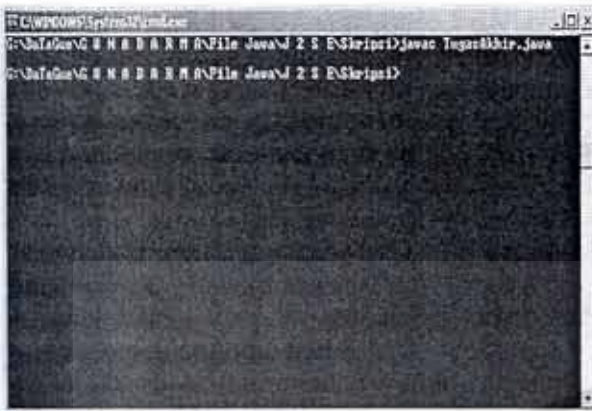
Gambar 2. Pengkompilasian program

Selanjutnya adalah mengeksekusi program. Caranya ialah dengan mengetik "java TugasAkhir". Perlu diperhatikan bahwa pada saat pengeksekusian program, ekstensi (.java) tidak dipergunakan. Output dari program dapat dilihat pada Gambar 3. Untuk menggunakan aplikasi ini, langkah yang pertama dapat dilakukan adalah memilih ordo dari matriks kunci penyandi. Pengguna dapat memilih "Matriks 2 x 2" atau "Matriks 3 x 3". Sebenarnya matriks tidak terbatas untuk dua ordo matriks tersebut, namun pada pembuatan Tugas Akhir ini,