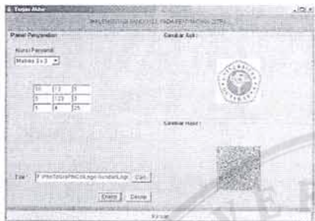
Gambar 5. Tampilan hasil enkripsi

dengan format berkas pada saat citra belum di lakukan operasi penyandian. Citra hasil, memiliki format berkas png.