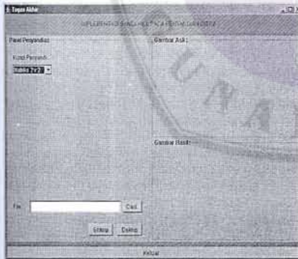
Gambar 3. Tampilan awal aplikasi

Selanjutnya adalah mengeksekusi program. Caranya ialah dengan mengetik "java TugasAkhir". Perlu diperhatikan bahwa pada saat pengeksekusian program, ekstensi (.java) tidak dipergunakan. Output dari program dapat dilihat pada Gambar 3. Untuk menggunakan aplikasi ini, langkah yang pertama dapat dilakukan adalah memilih ordo dari matriks kunci penyandi. Pengguna dapat memilih "Matriks 2 x 2" atau "Matriks 3 x 3". Sebenarnya matriks tidak terbatas untuk dua ordo matriks tersebut, namun pada pembuatan Tugas Akhir ini,