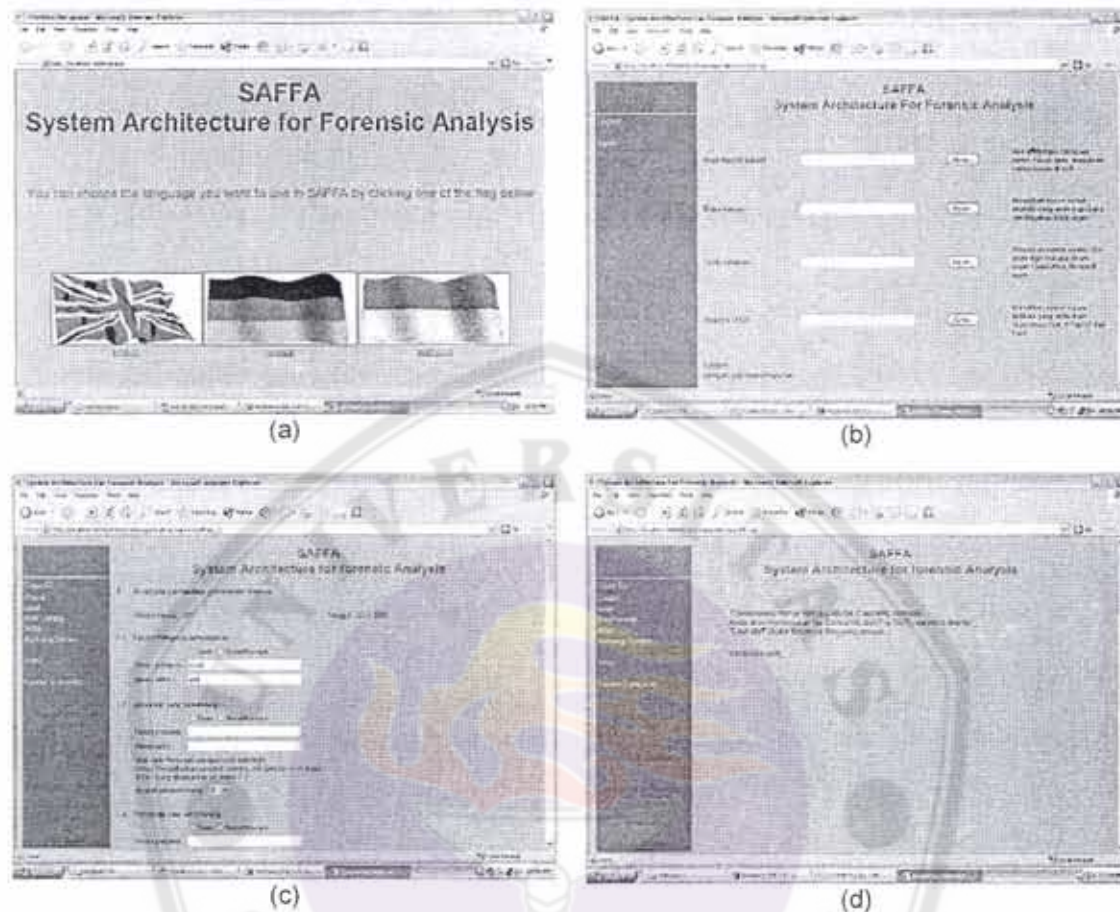
Gambar 2. Tampilan beberapa layar aplikasi