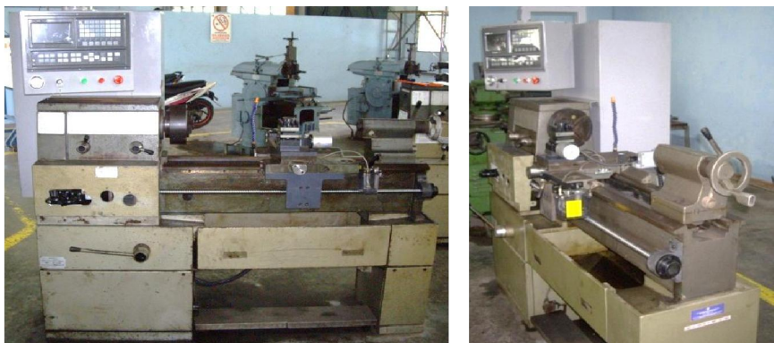
Gambar 2. Mesin bubut hasil retrofit

Kedua metode menghasilkan keputusan alternatif yang terurut dari yang terbaik adalah alternatif 3, 1, 2. Keputusan yang diambil adalah memodifikasi mesin bubut konvensional dengan menambah