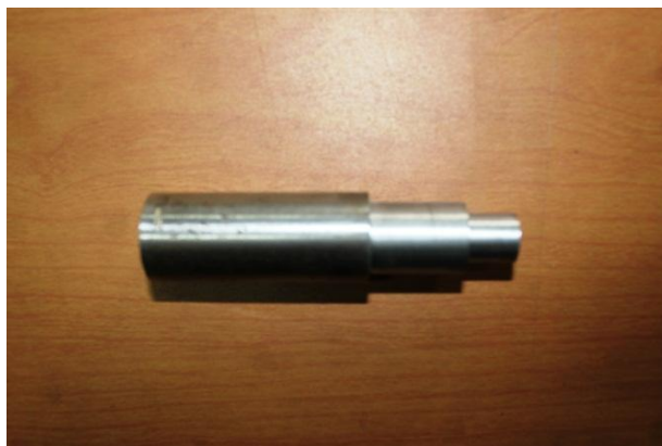
Gambar 4. Benda kerja