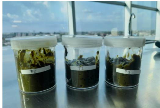
Gambar 2. Hasil Formula Gel Ekstrak daun jeruk purut ( Citrus hystrix DC)

mengandung senyawa yang mudah menguap seperti minyak atsiri [20]. Hasil ketiga formula dapat dilihat pada gambar 2.