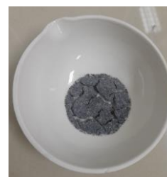
Gambar 1. Hasil Pengujian Kadar Abu ekstrak daun jeruk purut ( Citrus hystrix D.C)