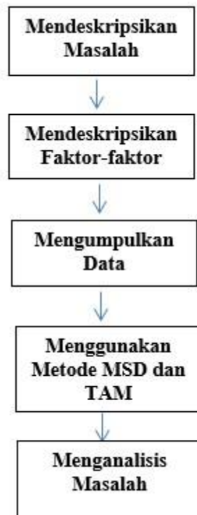
Gambar 1. Kerangka Kerja

Dari kerangka kerja yang dilakukan didapat dugaan sementara ( hipotesis ) dari penelitian ini, yang dijelaskan sebagai berikut: